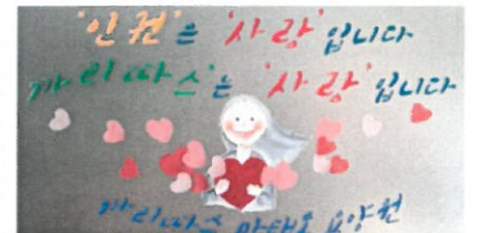
인권감수성 5행시 공모전